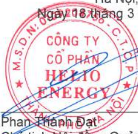
Phan Thành Đạt Chủ tịch Hội đồng Quản trị