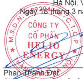
Phan Thành Đạt Chủ tịch Hội đồng Quản trị